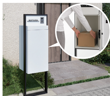
宅配ボックス スマート宅配ポスト

宅配ボックス・ポスト・サイン・インターホンの機能がコンパクトにまとまったオールインワンタイプ。敷地の狭い住宅にもぴったりで、複数荷受も可能。