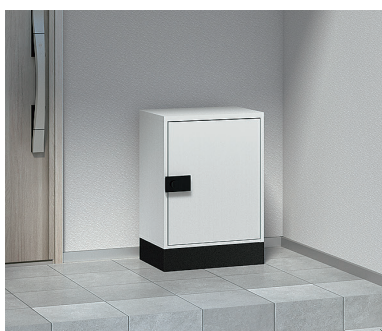
宅配ボックス 宅配ボックスKT

シンプルデザイン・簡単操作の宅配ボックス。スペースに合わせて据置仕様、荷物を取り出しやすいポール仕様から選べます。用途に合わせて2サイズをご用意。