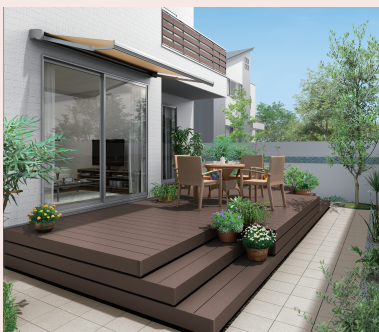
ウッドデッキ 樹ら楽ステージ

リビングとつながる解放感のあるウッドスペースで素敵なお庭まわりを実現。リビングからの景観もアップ。家族やペットとのくつろぎの時間が生まれます。