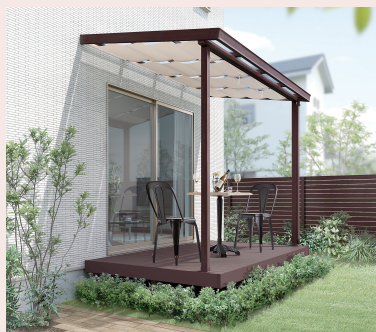
テラス屋根シェット

後付けテラス屋根で強い日差しや紫外線をカット。突然の雨でも安心。見た目もおしゃれでワンランク上のくつろぎ空間に最適です。