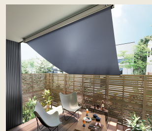
外付け日よけ スタイルシェード