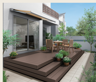
ウッドデッキ 樹ら楽ステージ

お庭まわりも充実させたい、そんな方におすすめのウッドデッキは庭とリビングをつなぐ光と風を感じるリラックス空間。さらに、暑い日差しを遮る外付け日よけを取付ければ、デッキ空間に心地よい日陰が生まれ、また室内もエアコン効率アップで光熱費削減につながります。