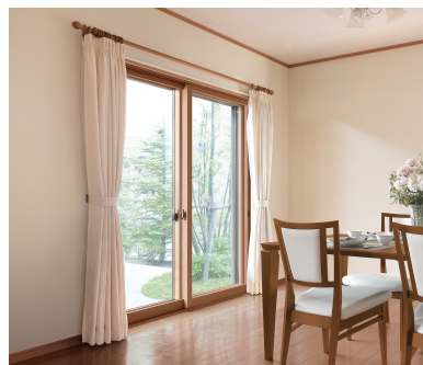
断熱内窓 (二重窓) インプラス

今ある窓の内側に新しい窓を取付けるだけ。1窓最短1時間のスピード施工で断熱性がアップして、結露も軽減します。