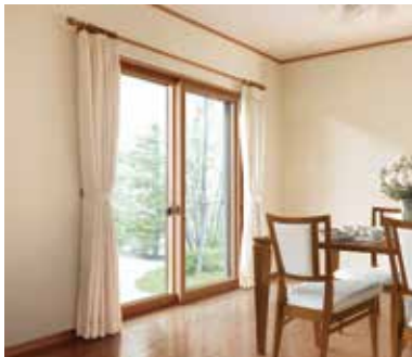
断熱内窓 (二重窓) インプラス

今ある窓の内側に新しい窓を取付けるだけ。1窓最短1時間のスピード施工で断熱性がアップして、結露も軽減します。